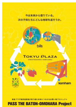
PASS THE BATON-OMOHARA