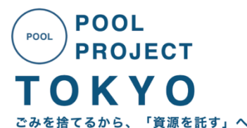
POOL PROJECT TOKYO