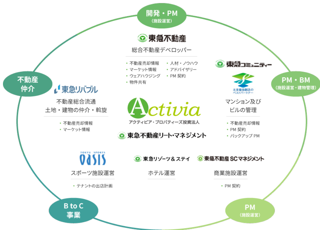
<東急不動産ホールディングスグループのバリューチェーン概念図>