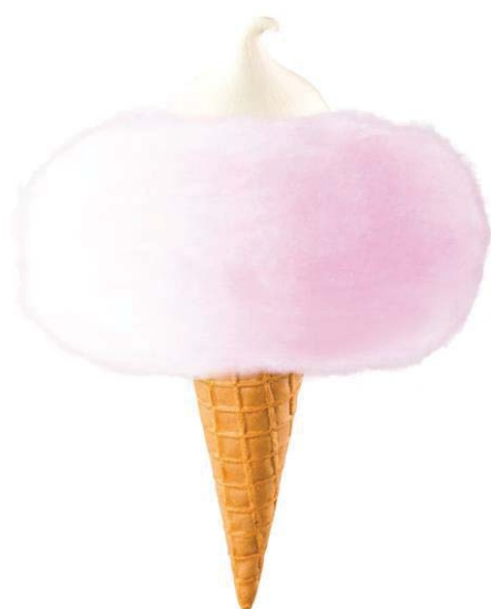
「リッチミルクコットンクラウド(ピンク)」