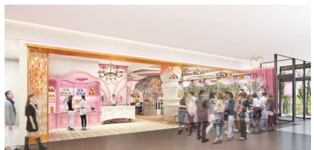
「Serendipity3 表参道」外観イメージ