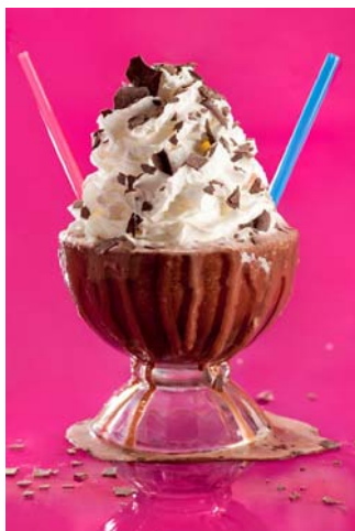
「Frrozen Hot Chocolate」 (フローズン ホットチョコレート)