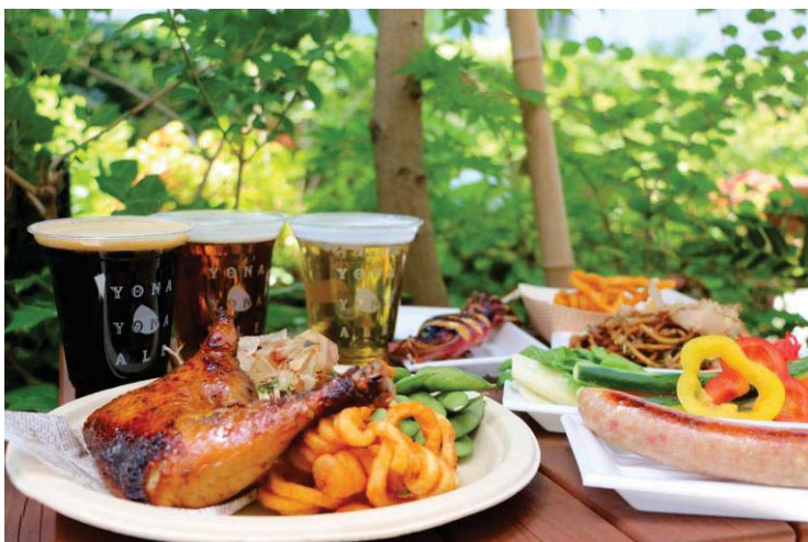
「OMOHARA BEER FOREST by YONA YONA BEER WORKS」イメージ ※写真は過去の様子。